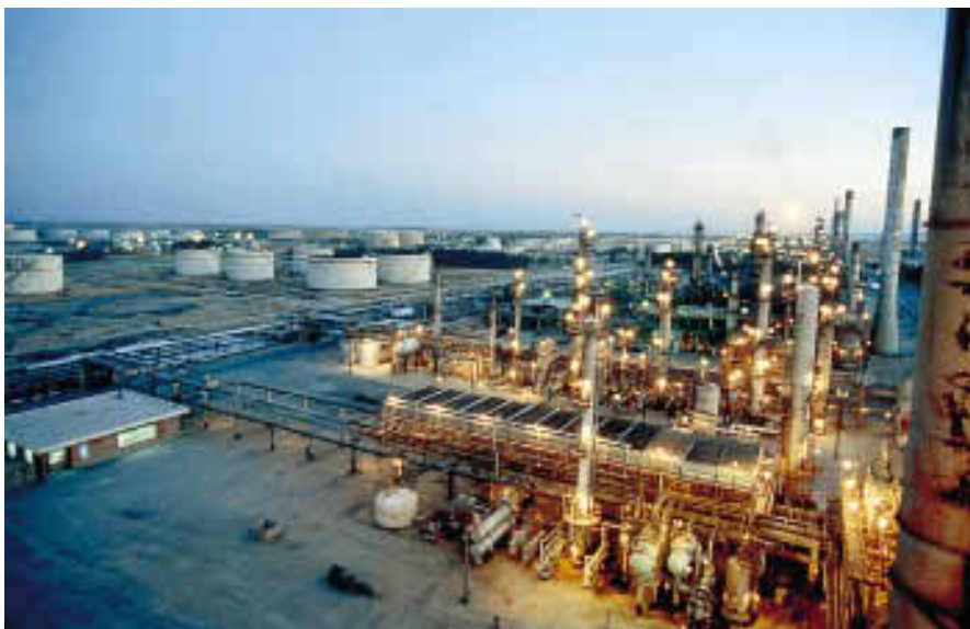
Une raffinerie de Téhéran, en octobre 1990. Grande richesse de l'Iran, les gisements de pétrole sont surtout situés dans le sud-ouest du pays. Les principales raffineries sont celles de Téhéran, de la région d'Ispahan et d'Abādān, sur le golfe Arabo-Persique. L'exportation s'effectue par le terminal pétrolier de l'île de Kharg.