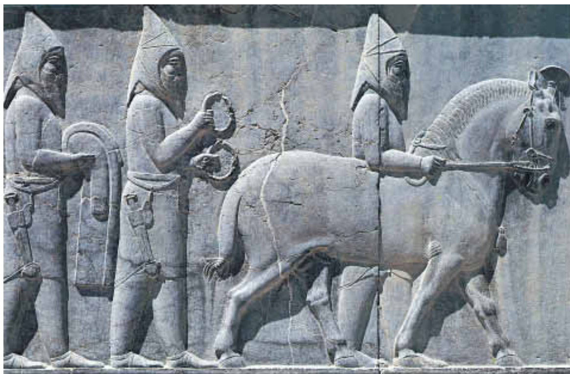
Bas-relief à Persépolis (VI e -V e siècle avant J.-C.). Il est situé dans l'escalier de l'apadana (salle des audiences royales). Les gardes, courtisans et peuples tributaires qui y sont représentés viennent rendre hommage au souverain achéménide, témoignant ainsi de la puissance perse sous Darius I er .

La Perse islamique. Affaiblie par des luttes continues, à l'ouest contre l'Empire romain, puis byzantin, à l'est contre les nomades hunns et turcs, la Perse fut conquise par les Arabes entre 637 (bataille de al-Qādisiyyah) et 642 (bataille de Nehāvend), et fut intégrée à leur empire. L'antique religion zoroastrienne fut alors supplantée par l'islām, principalement dans sa version