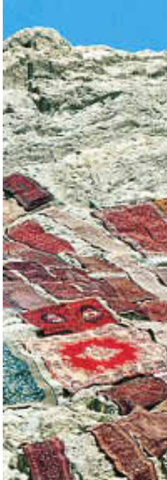
Séchage des tapis, produits d'un artisanat traditionnel de grande qualité.