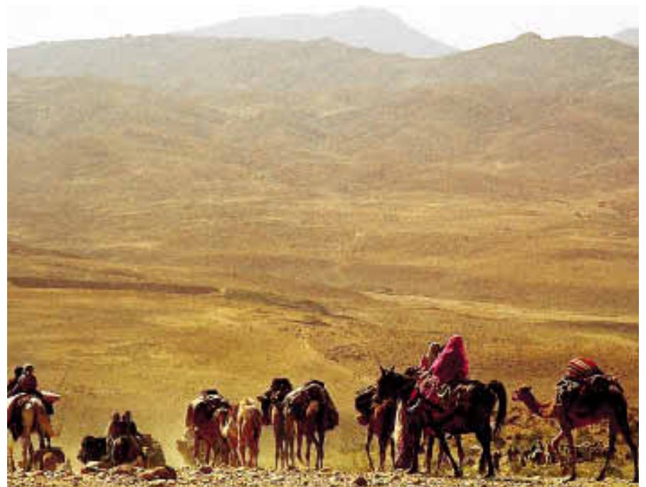
Les monts Zagros. S'étirant sur près de 1 800 km, entre la Turquie et le détroit d'Ormuz, cette chaîne de montagnes sépare le plateau iranien de la Mésopotamie irakienne. Difficile à franchir, elle abrite une population semi-nomade pratiquant l'élevage.

Les aspects humains. Le pays a connu, au cours de son histoire, de nombreuses invasions, notamment celles des Aryens, des Turcs et des Mongols. Ces apports successifs sont à l'origine d'une diversité ethnolinguistique qui subsiste sous le voile unificateur de la culture persane et de l'islām chi'ite. Les deux tiers des Iraniens ont le persan (ou farsi) pour langue maternelle et sont installés sur le plateau central. Parlant également des langues du groupe persan, les Kurdes (plus de 10 % de la population) sont surtout établis dans les provinces frontalières du nord-ouest et les Baloutches le sont au sud-est. Il y a, en outre, d'importantes minorités de langues turque (environ le quart de la population) et arabe (approximativement un million de personnes) ; les turcophones sont essentiellement originaires d'Azerbaïdjan, et les arabophones, du Khūzistān. La très grande majorité de la population est de confession chi'ite, mais il existe également des groupes